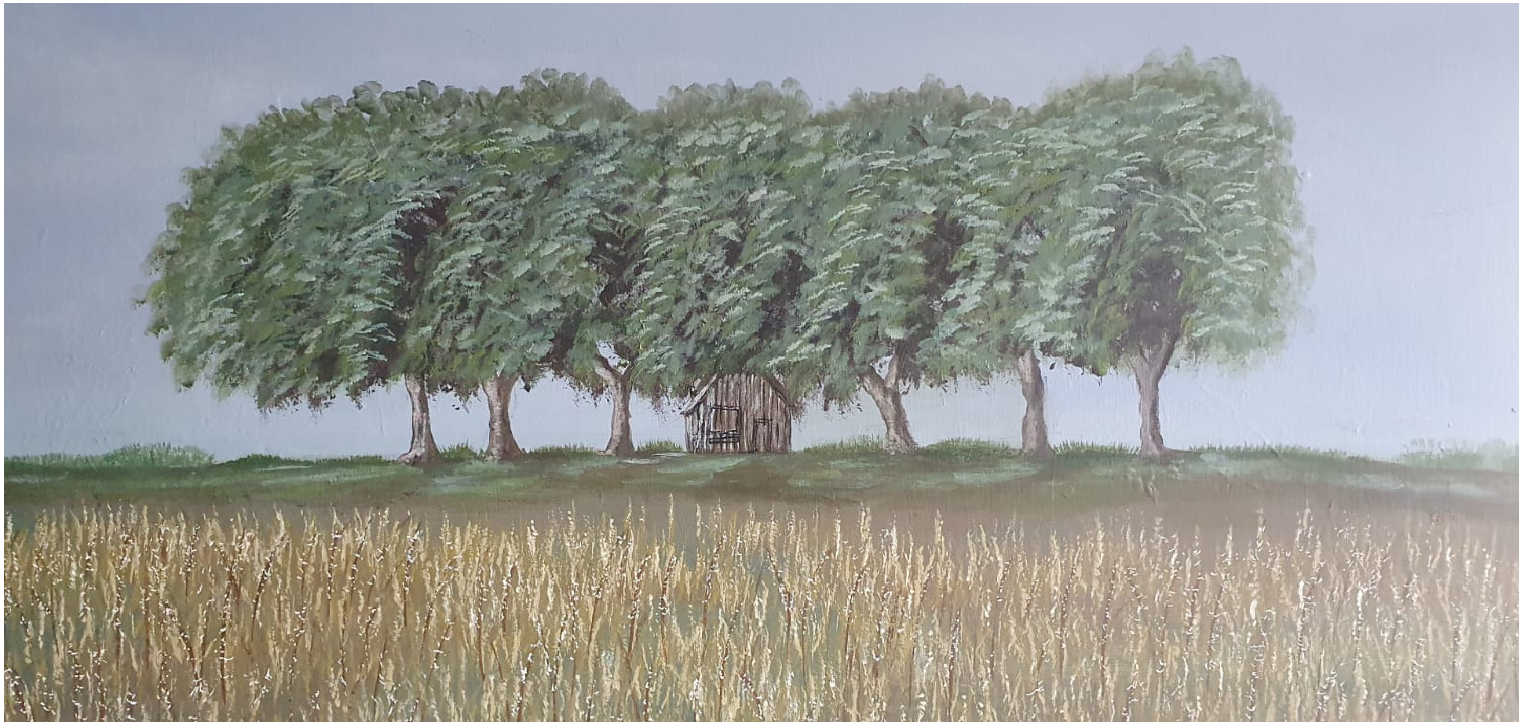
Fronte(i)ras, Alexandre Nistal