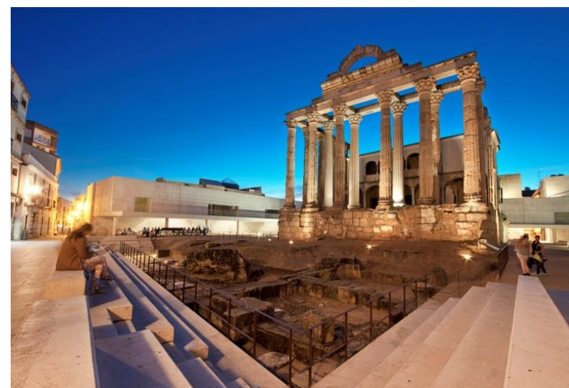
Templo de Diana, Mérida (Espanña)