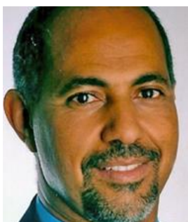
Embaixador Eurico Correia Monteiro República de Cabo Verde