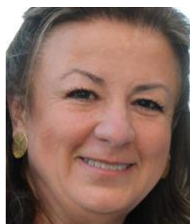
Embaixadora Carmenza Jaramillo República da Colômbia