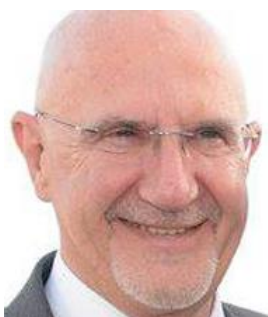
Embaixador Oscar Moscariello República Argentina

Embaixadores dos Países Afro-Ibero-Americanos acreditados em Portugal