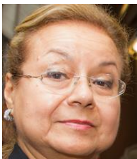
Ana Isabel Rodriguez Ministra da Embaixada do Paraguay

Convidadas | Chefes de Protocolo ou responsáveis pelo Protocolo das Embaixadas e Instituições dos Países Afro-Ibero-Americanos em Portugal.